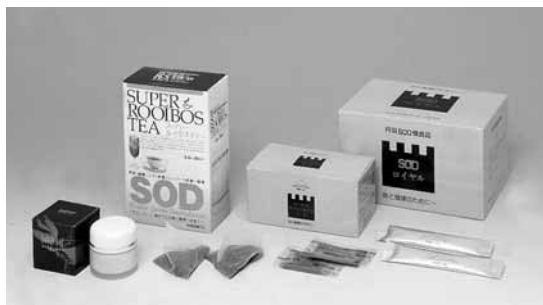
[当商品には合成着色料・合成保存料は使用していません]

丹羽博士が長年をかけて研究・開発し、多くの学会や研究機関で臨床成績が確認されているSODロイヤル(丹羽SOD様食品)を始めとする、活性酸素を除去するルイボスTX、スーパールイボスティ、SODクリームなどは、下記の取扱店でお求めになれます。